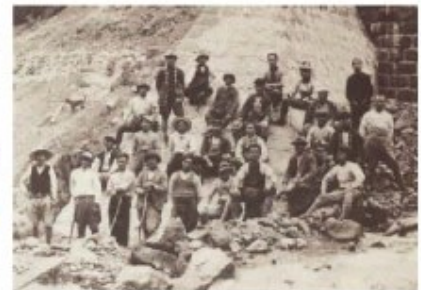
砂防事業に従事した地域住民 (昭和30年代)

家や道路などを壊し、人の命を奪う恐ろしい土砂災害から人命・財産を守るための事業を「砂防」と呼び、その工事に携わる人々を敬意を表して「砂守」と呼んでいます。《飛騨の砂守ツアー》では、北アルプスの大自然の中、普段間近に見ることのない砂防堰堤などを巡り、地域住民・砂守の土砂災害との闘いの歴史を学びながら奥飛騨の魅力を体験できるツアーです。