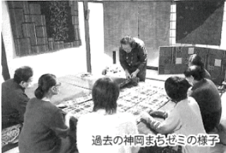
過去の神岡まちゼミの様子

10月16日(月)より第3回神岡まちゼミを開催致します。第1回・2回とも好評をいただきましたが、コロナ流行のため、