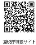
国税庁特設サイト