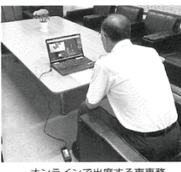
オンラインで出席する東専務

神岡の商店街や様々な場所で講座が開かれますので、お店・町の魅力を再発見していただくと共に、交流を深めていただければと思います。 開催内容等は、チラシ・SNS等で改めてご案内致しますので、ぜひたくさんのご参加をお待ちしています。